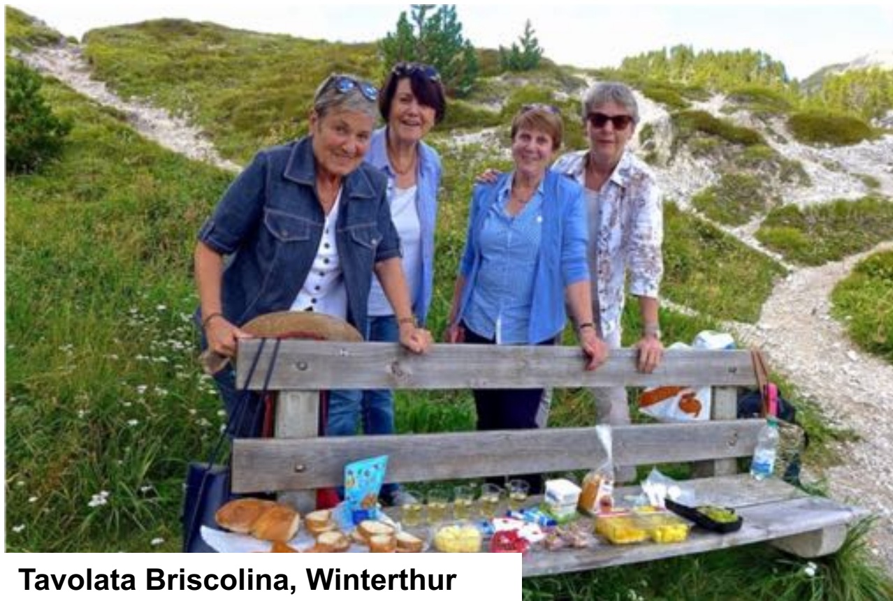
Tavolata Bricolina, Winterthur

Schicken Sie bitte ein Foto oder Souvenir an info@tavolata.ch oder per Whatsapp an 079 342 14 74.