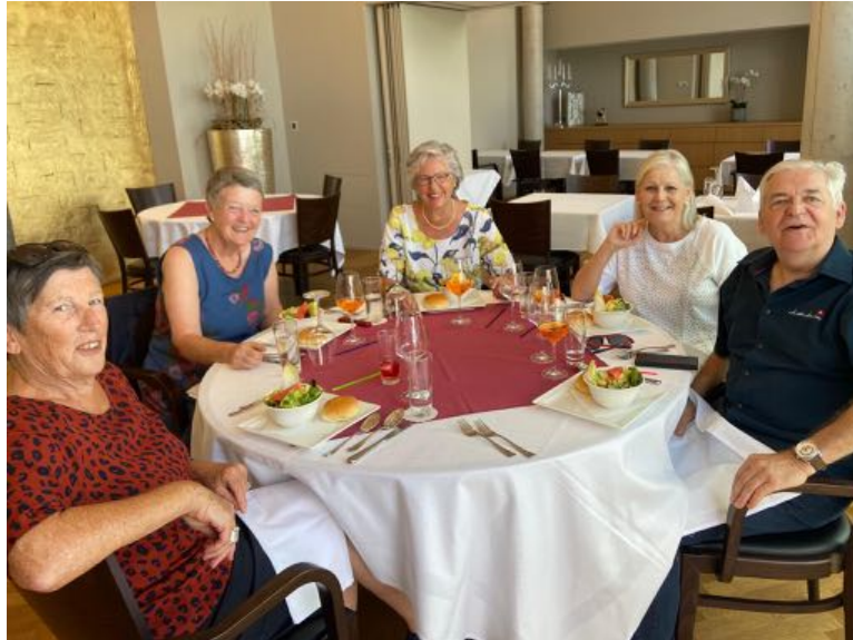
Tavolata Brunnen SZ

21. Mai 2022 treffen wir uns im Migros-Hochhaus in Zürich zur nächsten Tavolata- Jahrestagung!